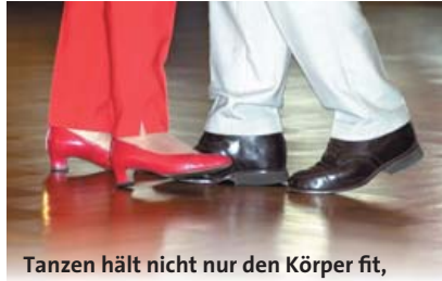
Tanzen hält nicht nur den Körper fit, sondern auch den Kopf.

Bei den Tieren wurde nun die Aktivität der Nervenzellen im Hippocampus beobachtet, jener Gehirnregion, die auch beim Menschen für das Langzeitgedächtnis zuständig ist. Bereits nach zwei Wochen schnitten die geselligen Mäuse bravourös ab, im Gegensatz zu den Singlemäusen in einfachen Käfigen: Soziale Kontakte, eine anregende Umgebung sowie regelmäßige Bewegung hatten die Kommunikation ihrer Nervenzellen optimiert.