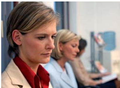
Viele Beschwerden, die zum Arztbesuch führen, sind psychosomatisch.

Wie sehr Körper und Psyche zusammenhängen, zeigt schon unsere